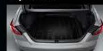
Khay hành lý