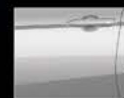
Trắng ngọc trai