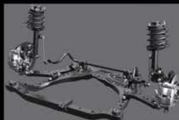
TÍNH LINH HOẠT