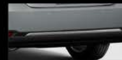
Ốp cản sau (mạ Crôm)