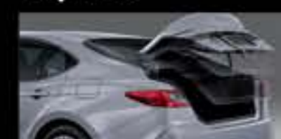
Mở cốp tự động