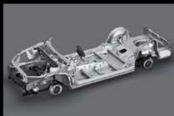
TÍNH ỔN ĐỊNH

Với triết lý tạo ra những chiếc xe tốt hơn bao giờ hết, thông qua định hướng TNGA, Toyota đã thiết kế lại toàn bộ cấu trúc khung gầm, củng cố nền tảng cốt lõi và mang lại khả năng vận hành tuyệt vời hơn cho khách hàng.