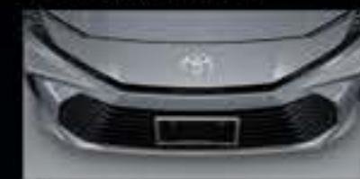
Ốp cản trước (mạ Crôm)