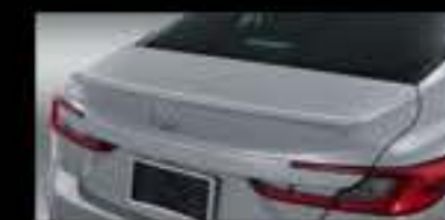
Ốp hướng gió khoang hành lý (chứa sơn)