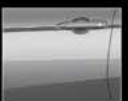
Xám ánh bạc