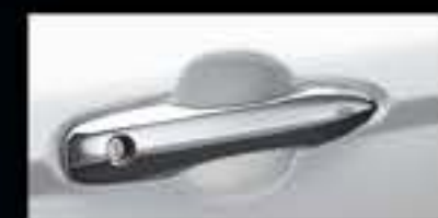
Tấm phim bảo vệ hõm cửa