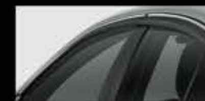
Vẽ che mưa