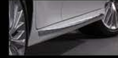
Ốp trang trí sườn xe (mạ Crôm)