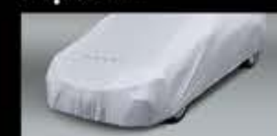
Bạt phủ xe