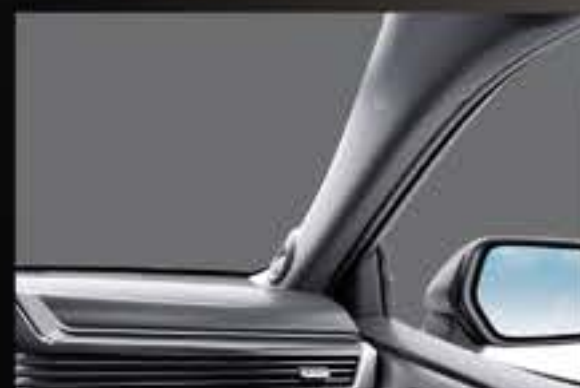
TẦM QUAN SÁT