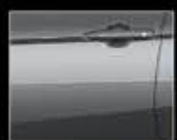
Xám ánh kim