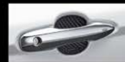
Ốp trang trí hõm cửa (vân Carbon)